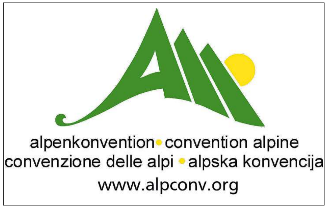
Logo e pagina d'internet da la Convenziun da las Alps.