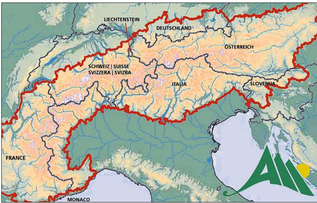
Il territori da las Alps en survista.